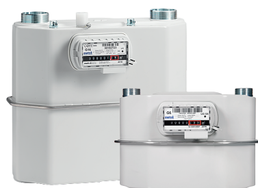
Contatori a Membrana