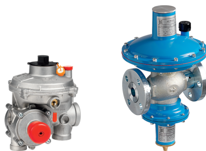
Regolatori di Pressione