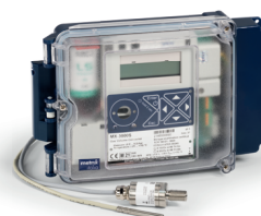
Correttori di Volumi Elettronici