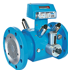
Contatori a Turbina