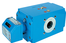
Contatori a Pistoni Rotanti